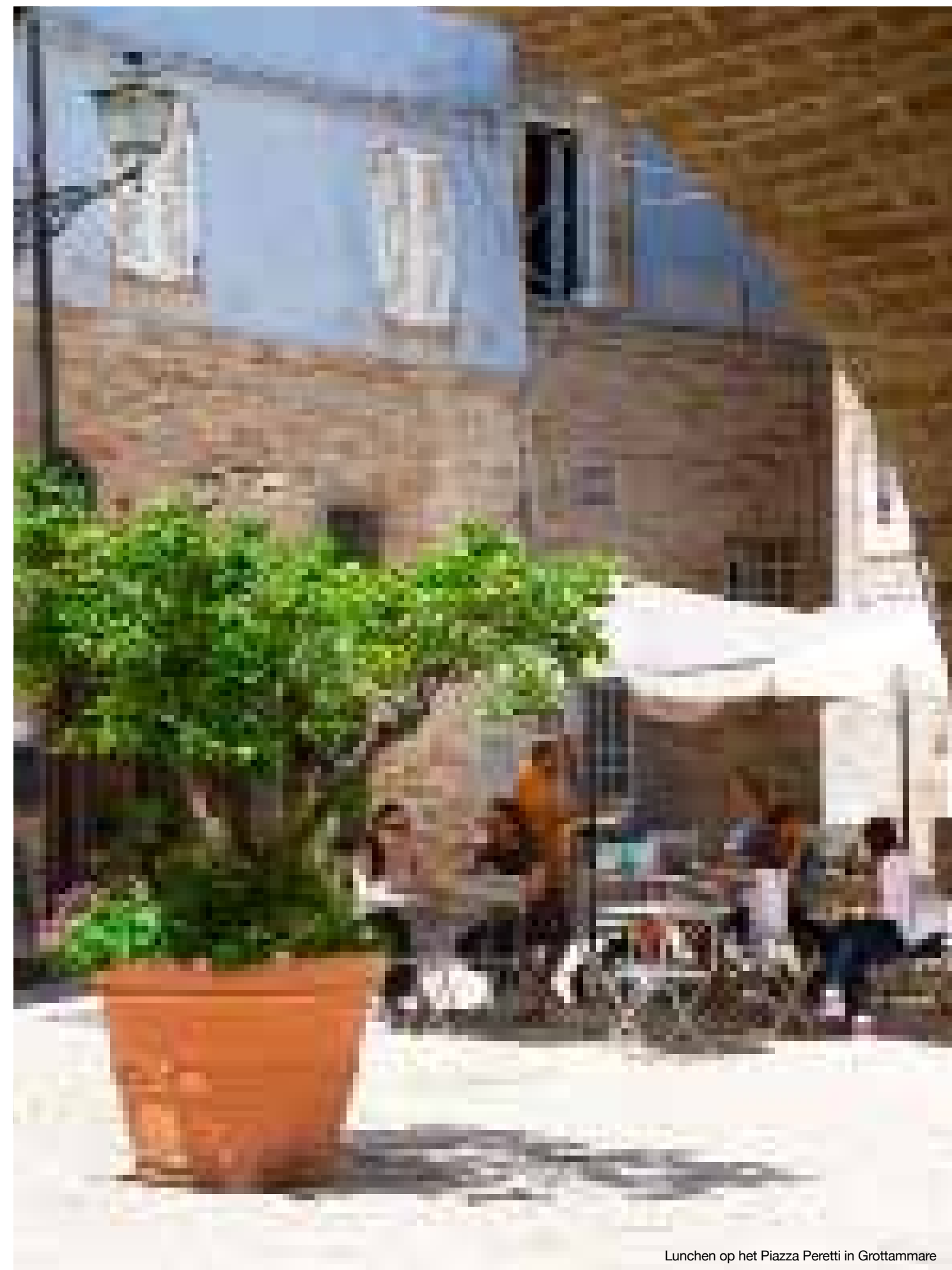
Lunchen op het Piazza Peretti in Grottammare

De Marken is onder toeristen een van de minst bekende regio's in Italië. Opmerkelijk, want deze veelzijdige regio heeft minstens zo veel te bieden als haar populaire concurrent Toscane. Wij stippelden een roadtrip uit die je langs de mooiste plekken in Le Marche rijdt. Stap je in?