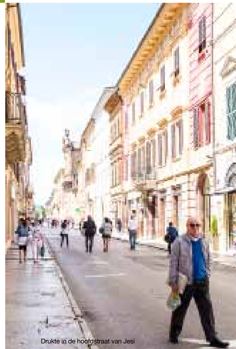
Drukke in de hoofdstraat van Jesi

Hoewel we nog uren van het natuurschoon hadden kunnen genieten, vervolgen we onze roadtrip naar de volgende bestemming, Jesi. We parkeren onze vierwieler in de Viale della Vittoria en lopen wederom via trappen omhoog richting het centrum. Jesi is een stuk levendiger dan Cingoli en dus strijken we voor een caffè neer op het terrasje van koffiebar Snoopy (laat je niet afschrikken door de naam, de koffie is er heerlijk!). We aanschouwen het échte Italiaanse leven: mannen op leeftijd die zich verzamelen