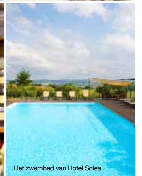
Het zwembad van Hotel Solea